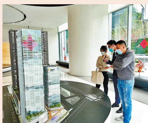
▲從事珠寶、教育和金融等人士紛紛前來了解樓盤。