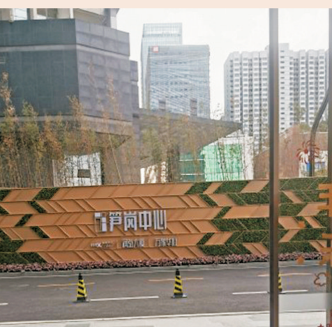
▲筍崗中心·萬象華府周邊是商廈及商場。