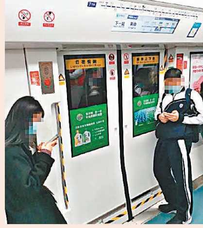
▲樓盤接駁7號線筍崗站。