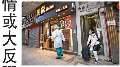
工作人員到伯嘉士大廈安排住客送檢。