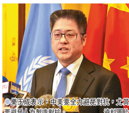
樂玉成表示, 中美要全力避免對抗, 尤其要避免人為製造對抗。