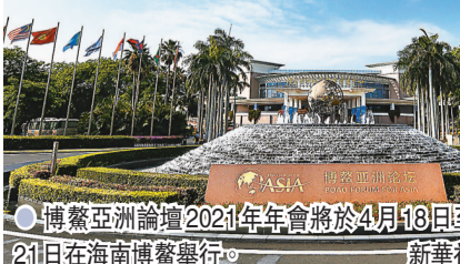
博鰲亞洲論壇2021年年會將於4月18日至21日在海南博鰲舉行。