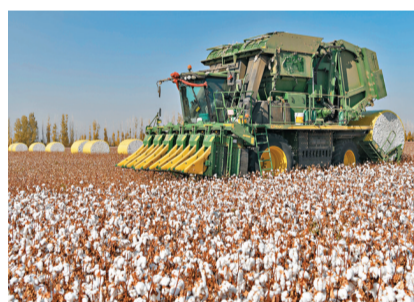
新疆棉花產業已基本完成機械化, 圖為採棉機在一處棉田作業。資料圖片