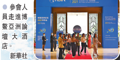
博鰲亞洲論壇2021年年會開幕式。新華社