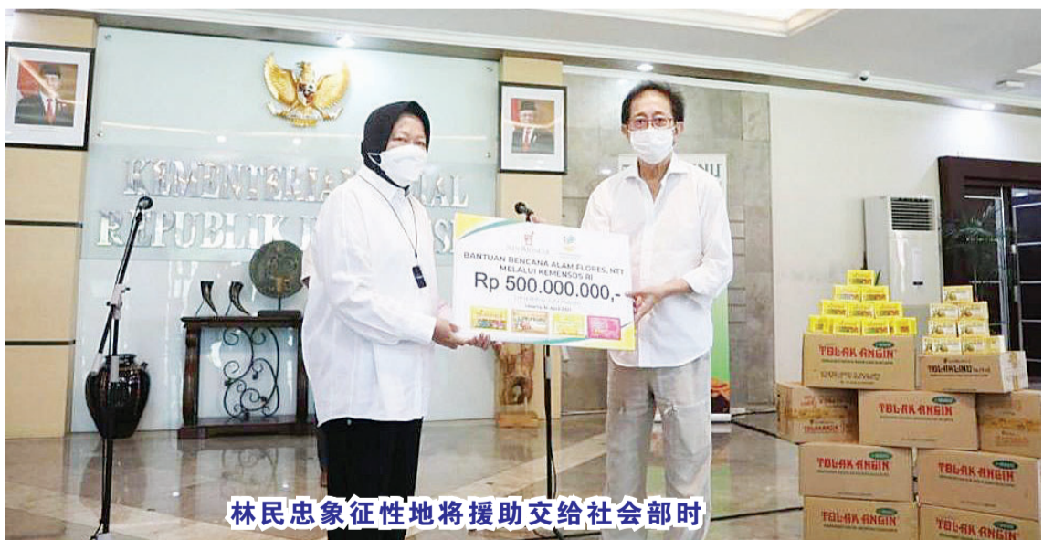
林民忠象征性地援助交给社会部时

忠说,这项援助是Sido Muncul 向东努省洪水灾民提供的第二次援助。他希望其方提供的援助,能协助减轻灾民的困境。