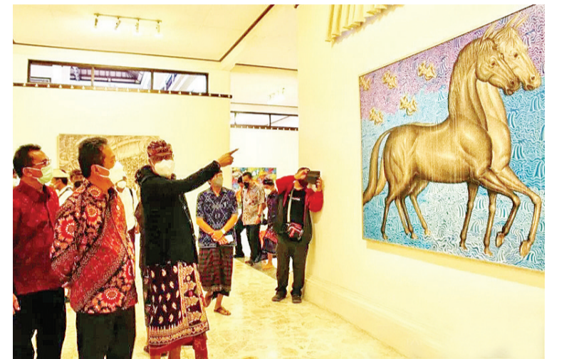
昆博士向萨克蒂部长介绍作品