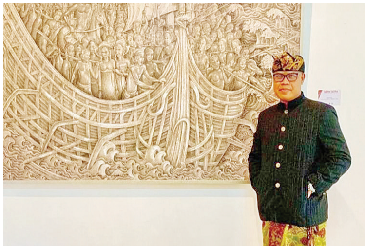
昆博士在画展现场