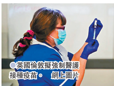
英國倫敦擬強制醫護接種疫苗。網上圖片

英國的新冠疫苗接種計劃已展開數月，不過在醫護人員之中仍然有人未打針，據英國媒體報道，國家醫療服務(NHS)在倫敦的管理