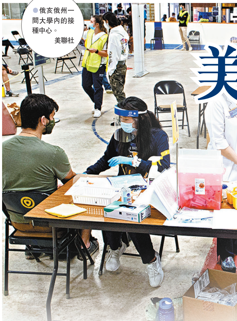
俄亥俄州一間大學內的接種中心。

不少國家或地區開始接種新冠疫苗之初，都優先讓醫護或長者等高危群組打針，但愈來愈多研究顯示，要防止新一波疫情爆發，亦有必要盡快為年輕人接種。美國即將從下周一一起，將合資格接種新冠疫苗的年齡組別，擴展至所有成年人，意味將有更多年輕人能開始打針。為了盡快重啟經濟及恢復日常社交活動，美國年輕人對於接種疫苗亦非常踴躍，民調顯示愈來愈多美國年輕人傾向打針，比率超過八成。