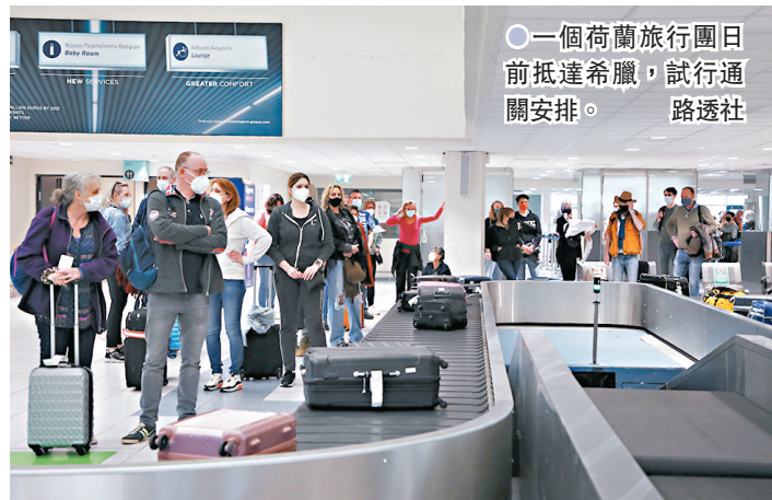
一個荷蘭旅行團日前抵達希臘，試行通關安排。

希臘為重振旅遊業，14日宣布將於下周一一起放寬對超過30個國家旅客的入境限制，若旅客入境時出示已接種新冠疫苗或病毒檢測陰性證明，便可豁免隔離檢疫，為下月中正式重新開放國際旅遊鋪路。希臘政府同日表示，當局將強制要求零售、餐飲及運輸業等服務業員工自行檢測，以便安全地逐步重啟經濟。