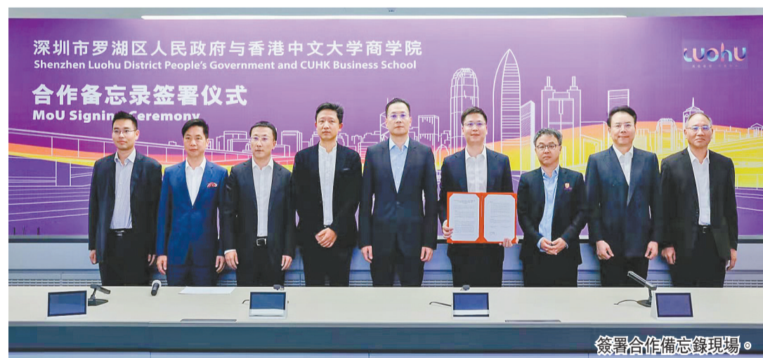
簽署合作備忘錄現場。

【香港商報訊】記者易小婧 通訊員周冠雄報導：香港中文大學(中大)商學院與深圳羅湖區政府日前在線上簽署合作備忘錄，共同推進中大商學院落戶羅湖區。羅湖區區長劉智勇、香港中文大學商學院院長周林共同簽署合作備忘錄，羅湖區委書記羅育德、香港中文大學常務副校長陳金梁出席見證。