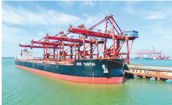
圖為正在作業的湛江港裝卸碼頭。

湛江港霞山港區散貨碼頭升級改造工程和湛江港30萬噸級散貨碼頭擴建工程建成後，湛江港將成為西南沿海首個通航40萬噸級船舶的世界級深水港，極大提升湛江港的區位優勢和競爭力。湛江港霞山港區將形成以一條40萬噸級散貨碼頭為依託，以一個40萬噸碼頭為主力，以25萬噸級、15萬噸級、7萬噸級散貨碼頭為補充的鐵礦石接卸、轉水、混礦及貿易分銷系統，進一步鞏固湛江港深水化、大型化、專業化核心競爭力，對湛江港打造南方大宗散貨分撥中心具有重要意義。