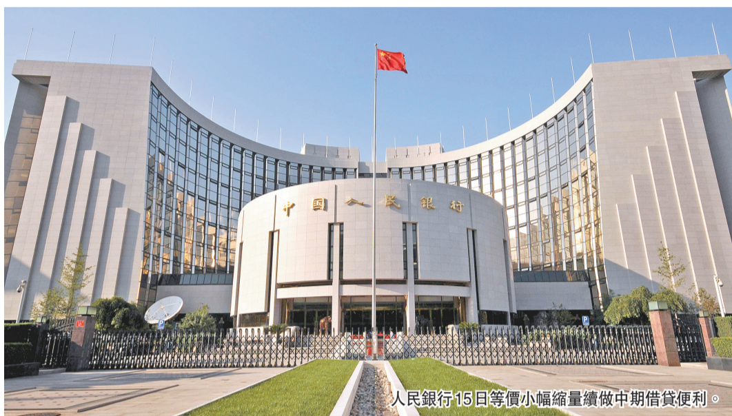
人民銀行15日等價小幅縮量續做中期借貸便利。

【香港商報訊】人民銀行昨日等價小幅縮量續做中期借貸便利(MLF)，對沖本月到期MLF和定向中期借貸便利(TMLF)以及實施100億元7天逆回購操作，當日實現淨回籠61億元，MLF和逆回購操作利率均保持前值。受訪專家認為，央行的操作符合預期，目前市場流動性整體合理，無論從經濟增長還是通脹的角度，今年貨幣政策都不具備收緊的條件。香港商報記者 朱輝豪