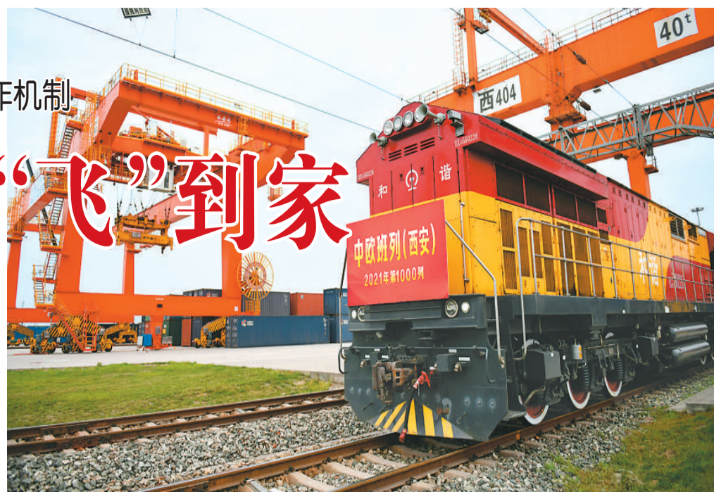
4月13日，X9041次中欧班列（西安）在西安国际港站准备出发开往哈萨克斯坦。

中国的茶叶、电视，卢旺达的咖啡、辣椒，泰国的香米、榴莲，马来西亚的白咖啡、燕窝……在电商平台下单，不用多久，您购买的中外好物就能送到家。随着“丝路电商”建设不断推进，很多中外消费者体验到了“在家购全球”的便利。目前，中国已与五大洲22个国家建立了双边电子商务合作机制。专家认为，“丝路电商”正成为“一带一路”建设中颇具发展潜力的经贸合作新引擎。