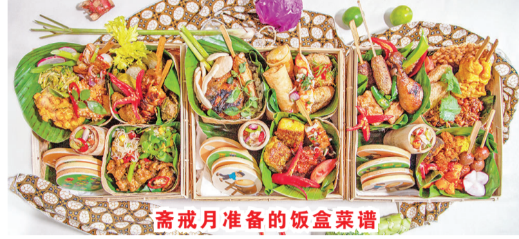
齋戒月準備的飯盒菜譜