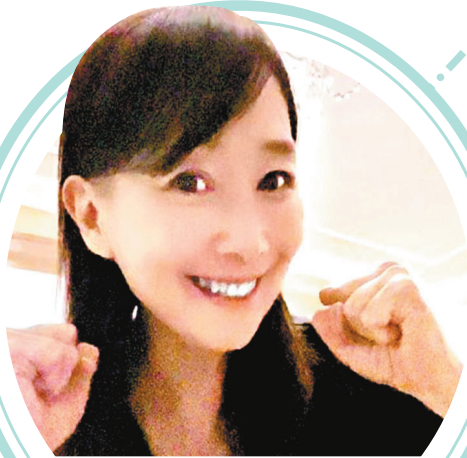
●陳美齡希望疫情早日消退，讓演唱會可全場爆滿。

提到大老闆黎瑞剛早前公開批評公司有五大缺失，大型招聘會是否做回應和招兵買馬跟友台「打仗」？珍姐稱公司一直全年在吸納人才，只是今年的招聘更集中。樂小姐就表示每天都在「打仗」，因為工作認真才有好作品製作出來，他們也樂意接受老闆的批評，有要求才有進步。至於面試者會否要做背景審查，避免如處境劇《愛·回家之開心速遞》曾出現「五一」手勢，或者不支持政府的幕後人士被辭職，珍姐稱之前都是單一事件不會作比較，最重要是新入職者做好他們範圍內的工作。