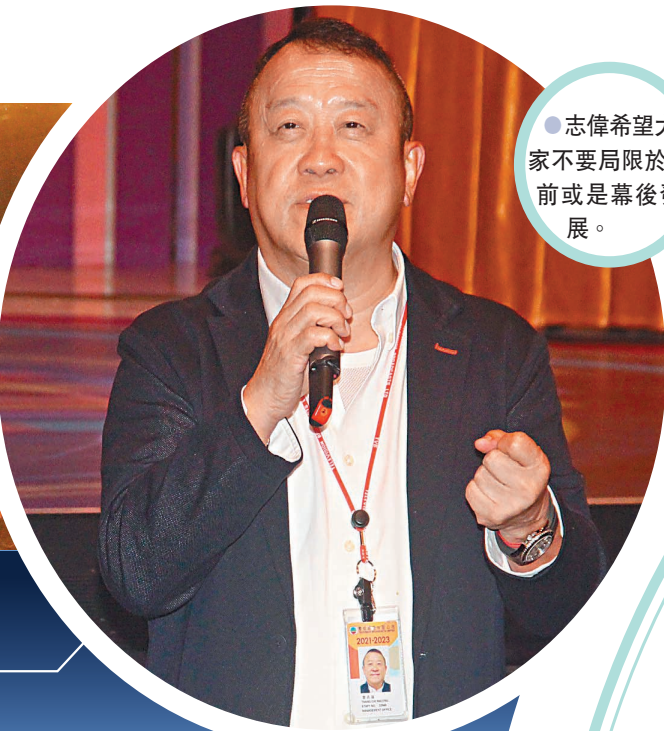
●志偉希望大家不要局限於幕前或是幕後發展。