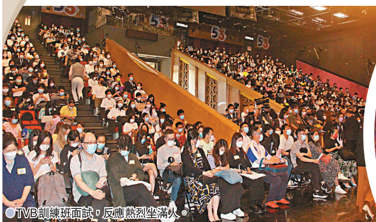
●TVB訓練班面試，反應熱烈坐滿人。