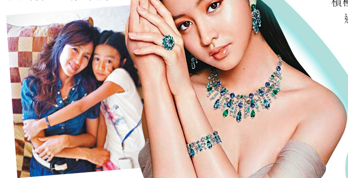
●木村光希分享兒時與媽媽的合照。

會，日前與主辦人開會後，音樂會決定名為《陳美齡~美麗人生半世紀》，也是她相隔近3年後再在港開騷，Agnes本人都十分期待。她透露下周開始會繼續開會討論有關內容，當有新進展會再作公布，現時她滿腦子都想著演唱會中選唱歌曲，除了會唱自己的歌，還會選唱其他歌手的香港經典名曲，屆時相信可以跟現場粉絲大合唱，Agnes問大家有什麼歌曲希望她唱的，都請積極點唱，團隊會認真考慮。Agnes在這段回港的日子，好好把握跟母親相處時光，她指：「晚上我為媽媽唱歌，媽媽用雙腿為我打拍子！真高興！好像在鼓勵我！」目前第四波疫情已受控，Agnes希望到9月時，疫情狀況轉好，能允許百分之百觀眾入場，那麼就會更熱鬧了。定下開騷計劃，為人正面積極的她自勉說：「有目標！有夢想！日子過得特別有意義。」