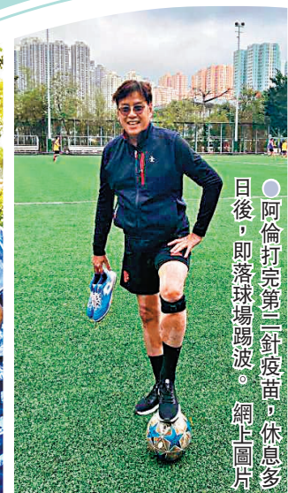
●阿倫打完第二針疫苗，休息多日後，即落球場踢波。