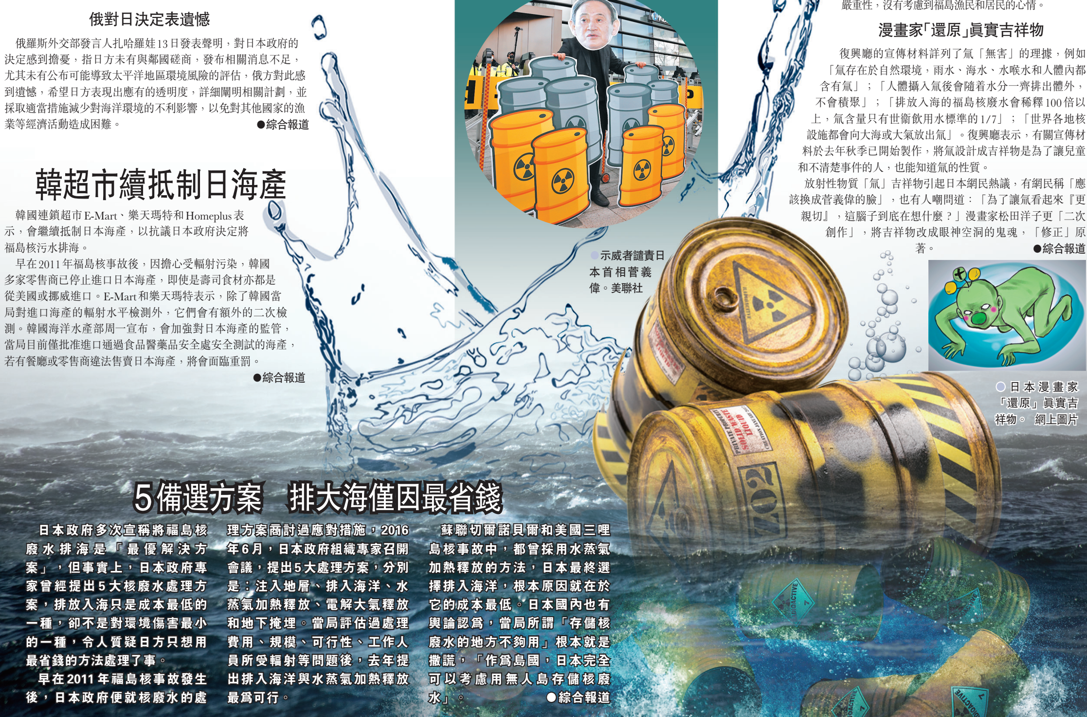
●示威者譴責日本首相菅義偉。