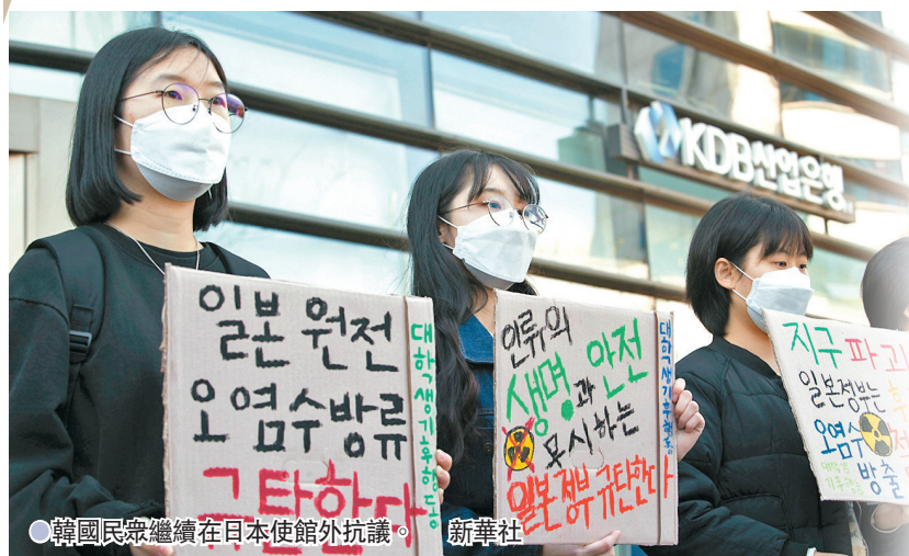
●韓國民眾繼續在日本使館外抗議。