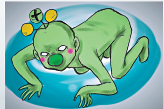
●日本漫畫家「還原」真實吉祥物。