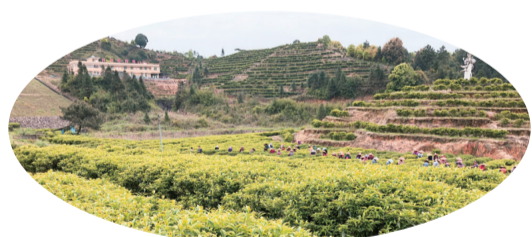
圖為凱達公司無公害生態茶園

大埔堅持把茶葉產業發展作為農業經濟發展的重要組成部分,着力改善基礎設施建設,促進一二三產融合發展。借助規劃建設茶葉現代農業產業園的契機,大埔致力於茶葉產業提質增效,不斷打響嘉應茶品牌。