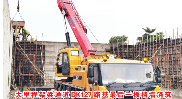
大里程架梁通道DK127路基最后一板挡墙浇筑

【本报讯】4月14日,中国中铁印尼雅万高铁4号制梁场(中铁四局一公司承建)大里程架梁主线关键节点DK127路基悬臂式挡墙施工全面完工。该段路基长341米,剩余挡墙施工1200立方米,AB料填筑20000立方米。在短短19天内,便安全、优质、高效的完成了路基全部挡墙施工任务,即将全面打通大里程架梁通道,保障了4月25日恢复大里程方向持续架梁重大节点工期!