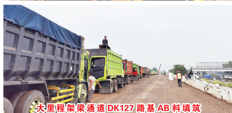
大里程架梁通道DK127路基AB料填筑

3月25日,DK127路基实现土地交付和获得进场施工许可,大里程路基受征地拆迁影响,被迫停工长达85天,严重制约了大里程架梁节点工期。打通大里程路基架梁通道尤为关键,为推进大里程架梁通道路基施工,梁场领导班子和施工班组精心谋划,复工迅速掀起全面大干高潮,进入“跑出加速度,按下快进键”的大干快干模式。在路基施工的19天内领导班子带头与现场中印