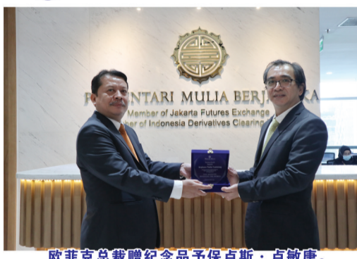
PT Mentari Mulia Berjangka 领导层

差价合约将是印尼商品交易行业的革新产物, 并为投资者提供更多优质的选择。他补充提供更多资源以教育广大投资者对于商品期货交易的正确投资观念, 并呼吁大众选择受商品期货交易监督管理局 (Bappebti) 监管的正式注册经纪商, 强调选择合法经纪商的重要性, 而PT. Mentari Mulia Berjangka是其中之一。我们期待PT. Mentari Mulia Berjangka将继续提供优质的客户服务及提升印尼商品期货的交易表现。