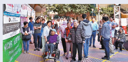
●林鄭月娥13日表示，草案建議賦權選舉投票當日的票站主任，為長者、孕婦等有需要的選民設立特別隊伍「關愛隊」取票、投票。資料圖片