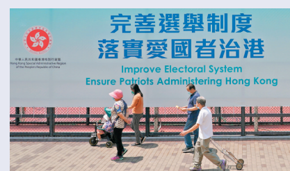
●香港深水埗街頭的「完善選舉制度 落實愛國者治港」巨幅廣告牌。