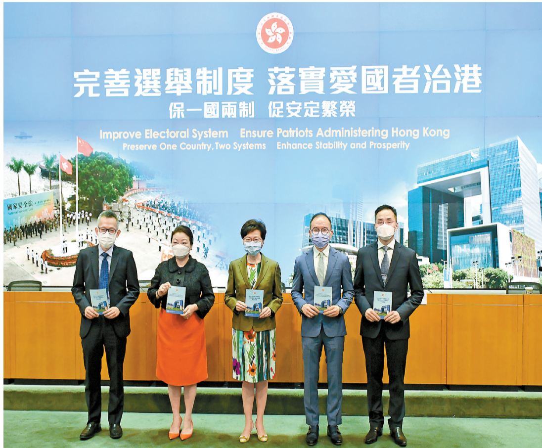
政府昨日提交條例草案，立法會今日將進行首讀和二讀。

他認為，草案平衡了社會不同持份者的聲音，賦予香港重回正軌的機會，解決了香港社會內耗不斷的困局，各界應把握契機，專注發展經濟民生，推動香港經濟升級轉型，在外循環中發揮積極作用。