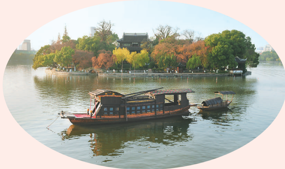
嘉兴南湖中共一大纪念船