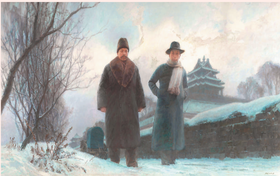
陈坚油画作品《南陈北李 相约建党》