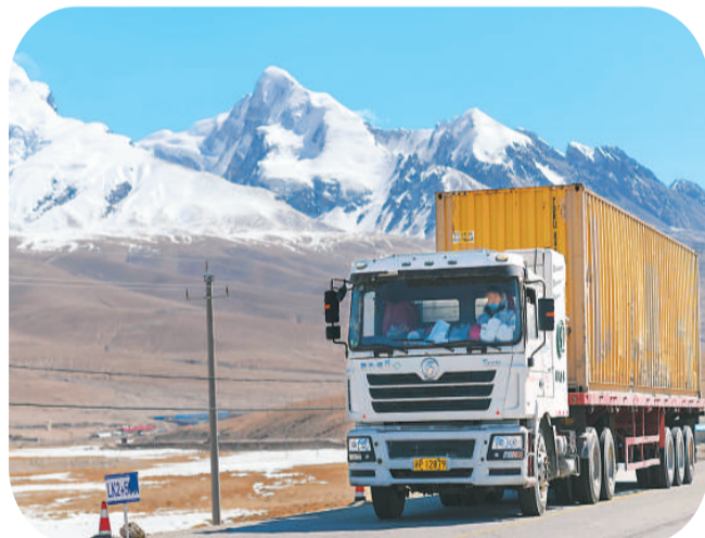
3月30日，在位于新疆塔什库尔干塔吉克自治县的中国-塔吉克斯坦边境卡拉苏口岸，中方车辆向集装箱正面吊车作业现场。