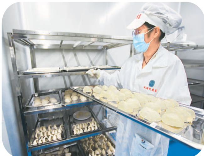
3月25日，位于中国（广西）自由贸易试验区钦州港片区的燕窝加工贸易基地，工人正在作业。