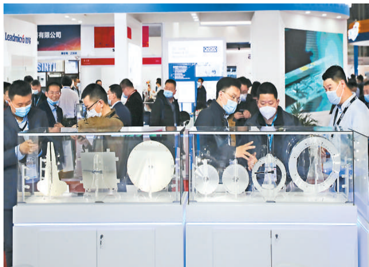
3月17日，2021中国国际半导体展在上海新国际博览中心开幕。