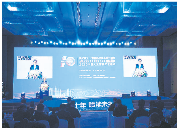
4月11日，中国人工智能产业年会在江苏苏州举行开幕式。新华社记者 季春鹏摄