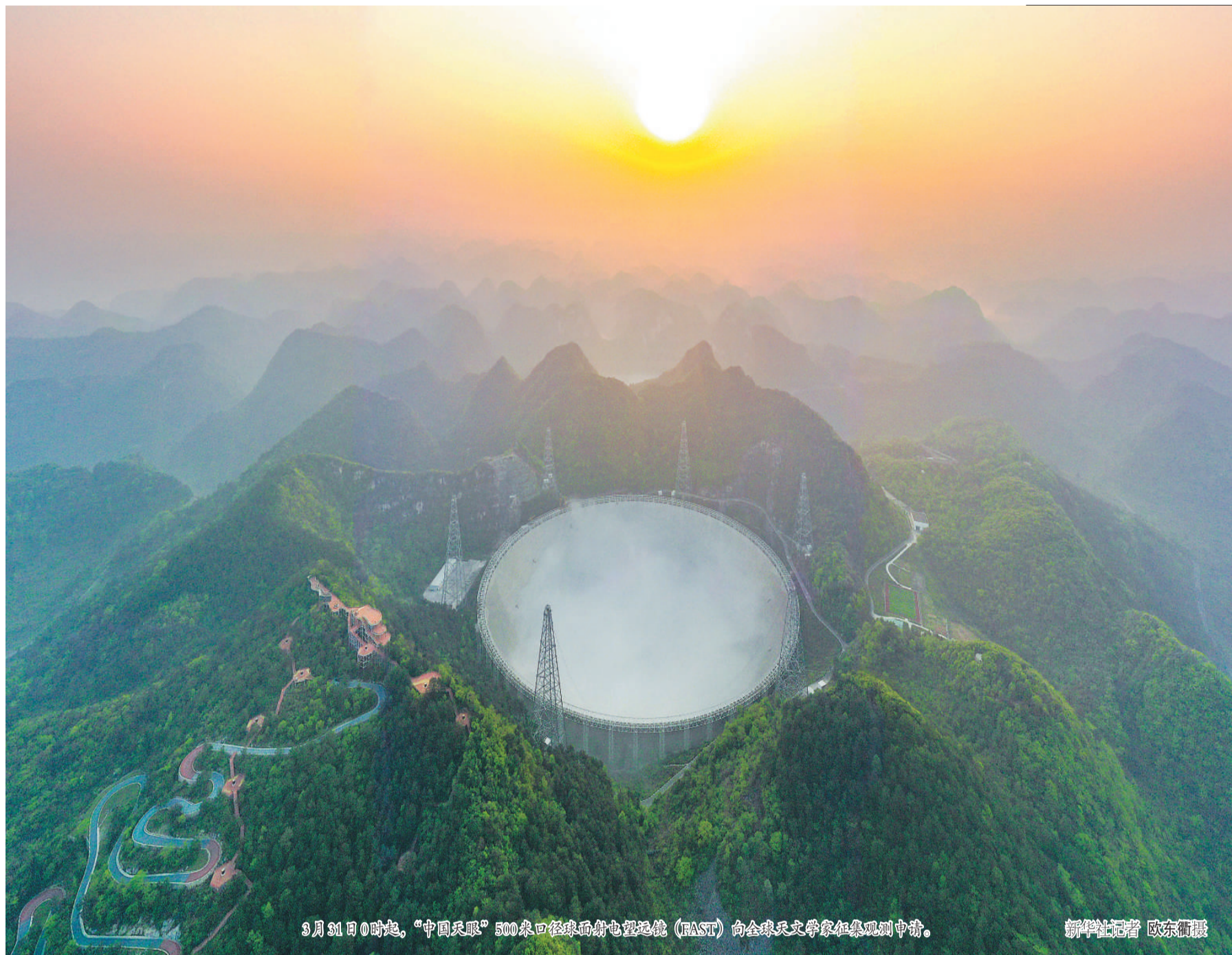
3月31日0时起，“中国天眼”500米口径球面射电望远镜（FAST）向全球天文学家征集观测申请。