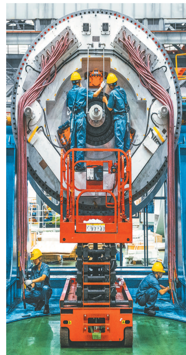
近日，在广东省阳江市明阳阳江智能制造中心风电整机装配车间里，工人通过吊机忙着对机舱和轮毂进行配件安装，开足马力赶订单。作为全球海上风电单体产能最大智能制造中心，该中心研发、制造的产品主要服务于沿海地区海上风电产业，畅销海内外市场。图为工人正在对产品进行配件安装调试。