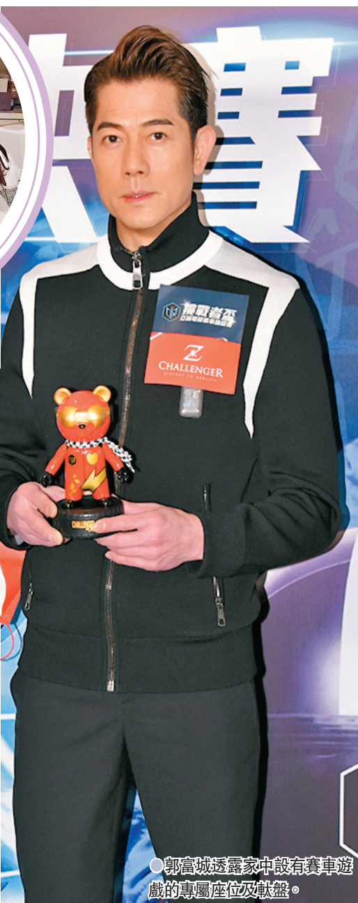
● 郭富城透露家中設有賽車遊戲的專屬座位及軟盤。