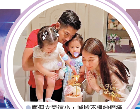
● 兩個女兒還小，城城不想她們接觸電子遊戲。資料圖片