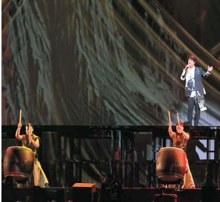
● 周華健在台北小巨蛋開騷。

東方味十足的「俠客行」舞台。中場則時空跳躍到充滿科技感的「少年遊」，呼應演唱會主題「少年俠客」。 周華健除了演唱自己的招牌歌，也翻唱《愛江山更愛美人》、《紅塵客棧》、《鐵血丹心》等。齊豫相隔16年二度擔任周華健演唱會嘉賓，兩人合唱的《天下有情人》，也獲得觀眾掌聲不斷。 周華健在台上表示，開唱前工作人員看到