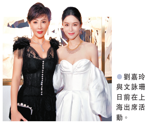
● 劉嘉玲與文詠珊日前在上海出席活動。

香港文匯報訊 劉嘉玲、文詠珊、盛一倫、陳星旭及于朦朧等前晚在上海出席高級珠寶品牌活動。兩位香港女星劉嘉玲和文詠珊佩戴高級珠寶首飾亮相，優雅高貴，典雅大方。兩代「女神」一起合照，同框畫面讓人大飽眼福。 此外，劉嘉玲日前還原柯德莉夏萍造型，錄製最新一期內地綜藝節目《百變大咖秀》。節目中，大張偉、白凱南和沈凌三個人，十分鐘模仿了上世紀九十年代紅極一