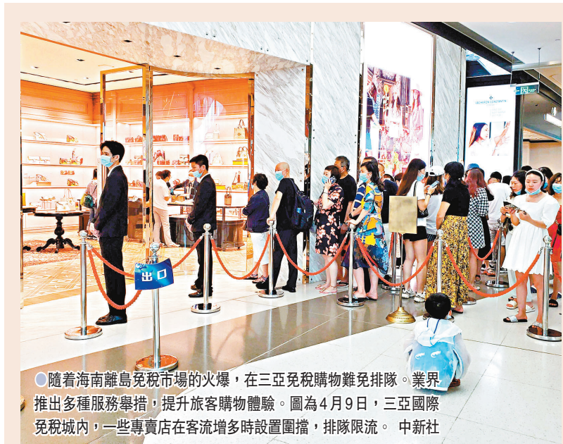
隨着海南離島免稅市場的火爆，在三亞免稅購物免稅免排隊。業界推出多種服務舉措，提升旅客購物體驗。圖為4月9日，三亞國際免稅城內，一些專賣店在客流增多時設置圍欄，排隊限流。

海南省委書記、省人大常委會主任沈曉明稱，在疫情導致國際旅遊中斷背景下，海南出台了多項措施促進境外消費回流，去年吸引境外消費回流規模在2019年150億元(人民幣，下同)的基礎上翻了一番，「今年預計能夠超過600億」。