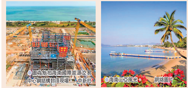
圖為航拍海南國際機場交易中心鋼結構封頂現場。