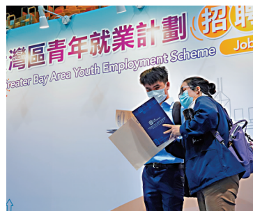
「大灣區青年就業計劃招聘博覽」早前舉行，有應屆畢業生到場求職。