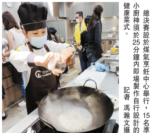
總決賽設於煤氣烹飪中心舉行，15名準小廚神須於25分鐘內即場製作自行設計的健康菜式。

是次比賽獲得多個機構及單位支持，邀得兒童糖尿協會、香港營養師協會及香港中華煤氣有限公司為協辦單位，以及教育局、樂善堂余近卿中學及獅子會何德心小學為支持機構。