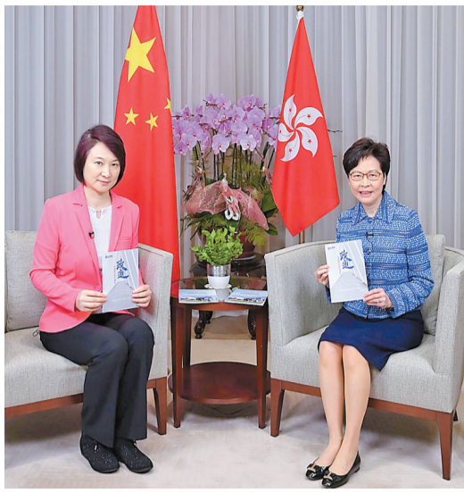
行政長官林鄭月娥(右)在社交媒體發文，分享早前接受民建聯主席李慧琼(左)訪問時對培育政治人才的想法。

【香港商報訊】記者馮仁樂報導：行政長官林鄭月娥昨於社交媒體發文，文中引述中新社專訪香港大學法律學院教授陳弘毅的稿件，她表示認同當中觀點，指完善後的選舉制度將吸引部分因原來泛政治化環境而卻步的人士從政，包括參選立法會或加入特區管治團隊。她期盼更多有才幹、有熱誠、愛國愛港的人士出任議員或官員，從而切實提升特區治理效能，為市民做實事。