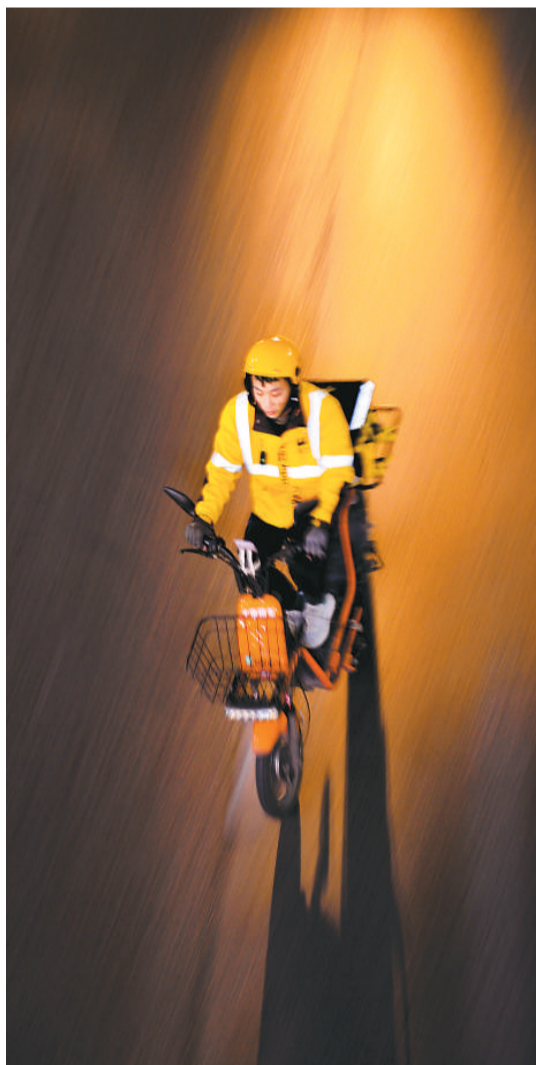
重庆街头，网约配送员在送餐途中。