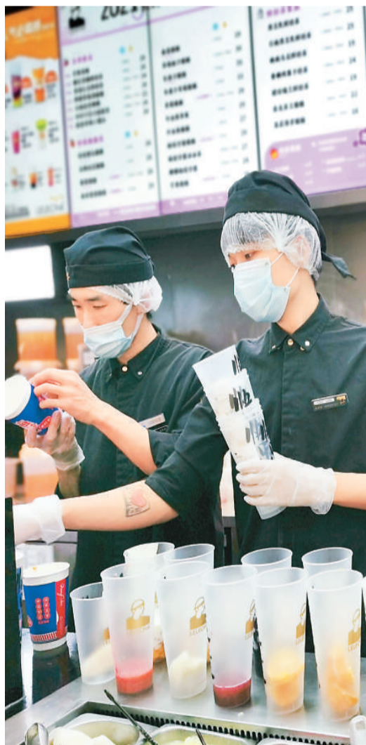
4月6日，在北京市朝阳区合生汇的一家奶茶店，调饮师在为顾客准备奶茶。