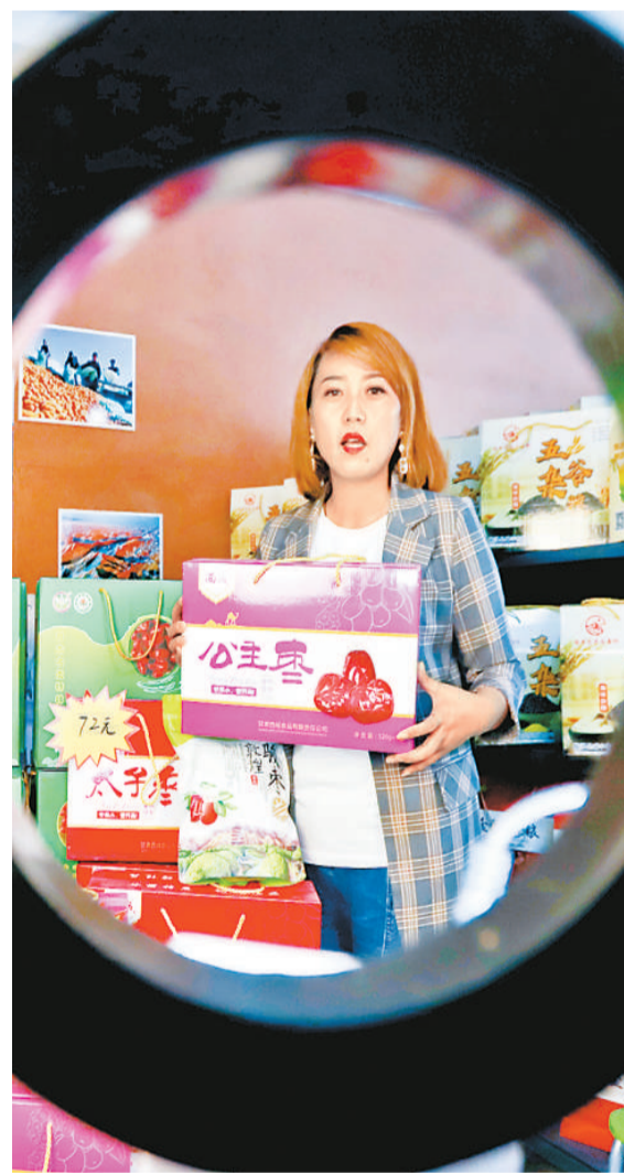
一名直播销售员在金张掖文旅农牧特产馆直播间为临沂红枣带货。

“要脚踏实地，深入生活，投身职场活动，同时观察自己的能力，找到两者紧密结合的发展方向，应对不断变化的市场。”陈宇说。