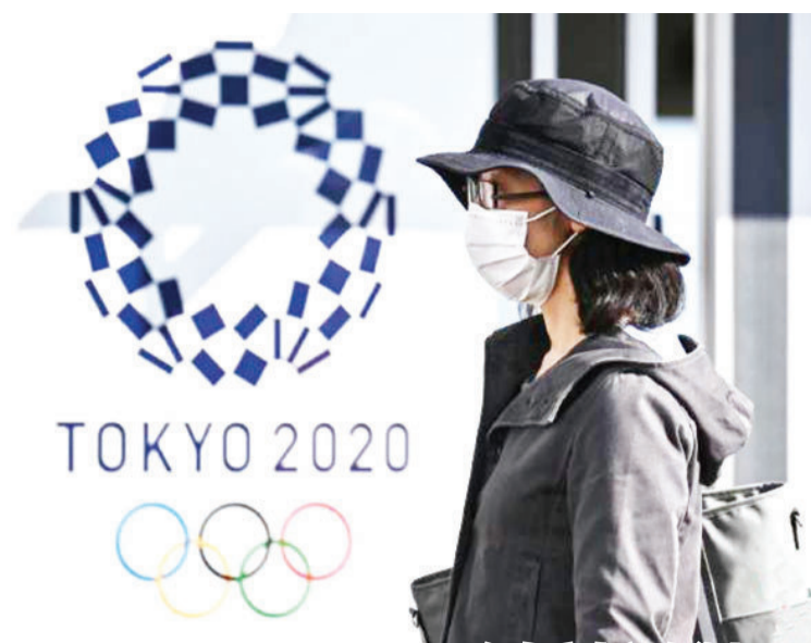
资料图:一名女士走过2020年东京奥运会海报。

日元。另外,东京奥组委还将准备大约30辆能够为司机提供特别防护的车辆,用于将检测阳性的运动员从奥运村送往这家酒店。