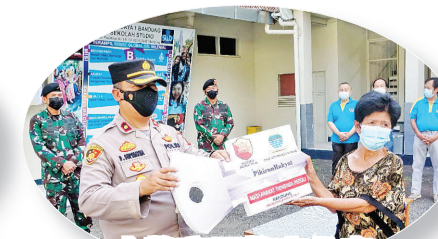
大警察局警官代表把“锁匙”移交给屋主