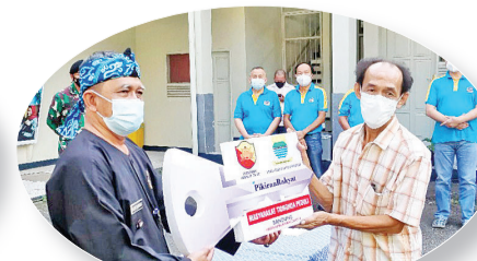
村代表把“锁匙”移交给屋主