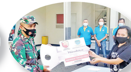
军区副官把“锁匙”移交给屋主