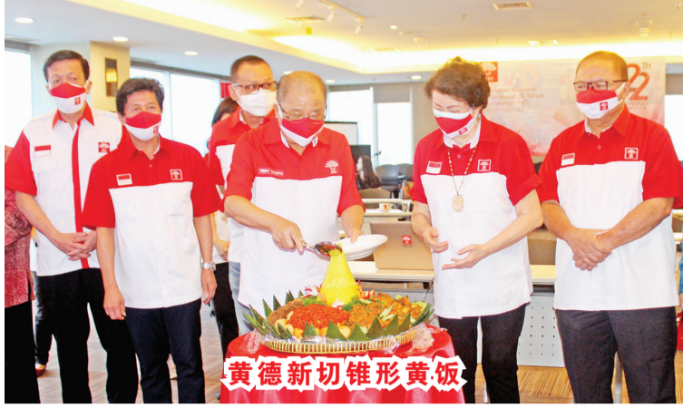
黄德新切锥形黄饭