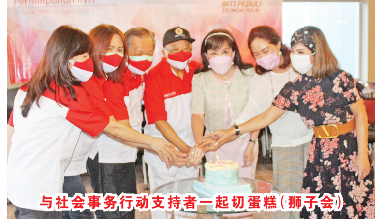
与社会事务行动支持者一起切蛋糕(狮子会)