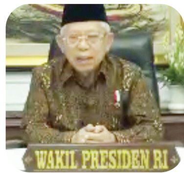
马鲁夫·阿敏副总统