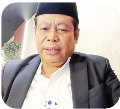
马尔苏迪苏胡德主席