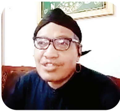
乌里尔·阿布沙尔·阿布杜拉