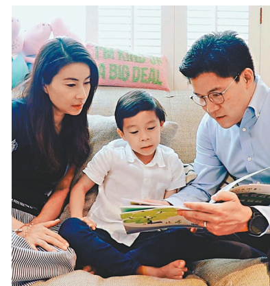
●霍啟剛夫婦相當重視親子關係。資料圖片