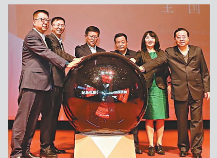
●電影《一起走過》日前在武漢舉行首映式。

2020年初，中央新影集團先後派出了兩批共9人的攝製隊伍，深入武漢抗疫情一線進行拍攝。影片主創團隊真實記錄下家國情懷、生動故事，塑造了「天使白」「橄欖綠」「守護藍」「志願紅」等一大批各行各業的平凡英雄。影片從國家、民族、城市、個人等不同側面出發，通過「國」與「家」的情感交織、艱難抉擇，將個體記憶融入宏大敘事中，體現對個體生命的尊重與守護。該片將於4月20日在全國院線公映。