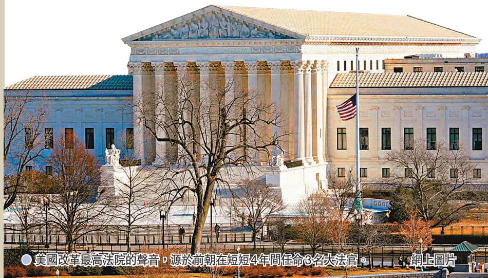
● 美國改革最高法院的聲音，源於前朝在短短4年間任命3名大法官。