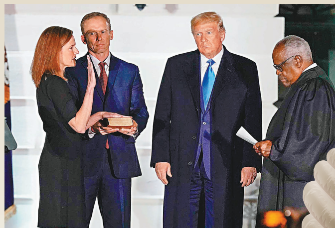
● 大法官巴雷特的任命過程引起不少民主黨人不滿。

香港社會近年出現要求司法改革的呼聲，事實上全球多地亦有同類經驗可參考，當司法制度出現問題時，即採取行動來改善。美國總統拜登於9日簽署行政命令成立委員會，研究改革聯邦最高法院大法官架構，未來措施可能包括增加大法官人數，以及限制大法官任期等；不過由於問題在美國社會具爭議，委員會預料不會直接就議題給出建議，而是就改革利弊提供詳盡分析，讓社會有討論空間。