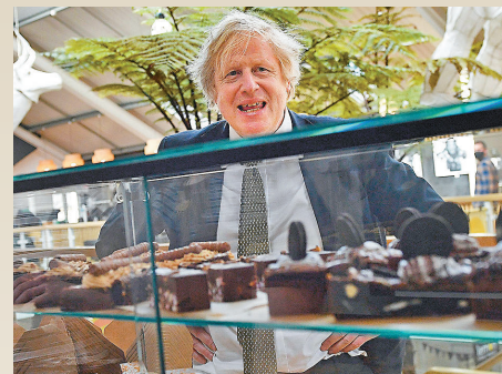
● 約翰遜去年推出的多項政策被民眾提出司法覆核阻撓。