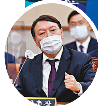
● 文在寅推動的改革引起尹錫悅(小圖)不滿。