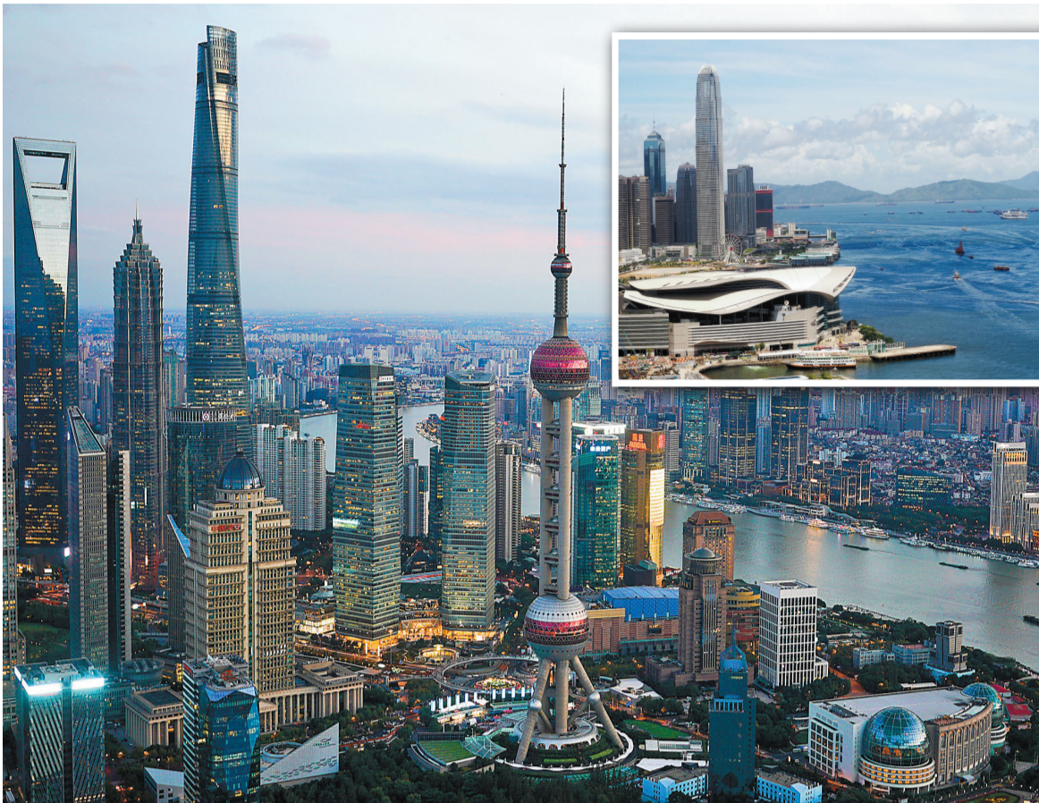
因經濟復蘇及人民幣升值影響，上海取代香港成為生活成本最高城市，香港由去年的第一位跌至第三。