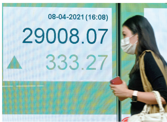
●港股8日重上29,000點，大市交投高達2,813億元。

另外，Cenovus Energy 董事陸法蘭8日回應傳媒查詢，說部分傳媒在報道加拿大一個能源研討會時，誤解了Cenovus行政總裁Alex Poubaix的說話，指其暗示Cenovus正在出售