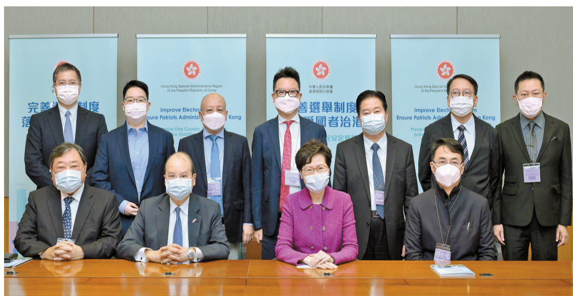
張建宗昨主持2場解說會，就完善香港特別行政區選舉制度繼續進行解說。特首林鄭月娥（前排右二）出席了其中一場會面，並與張建宗（前排左二）和陳國基（後排右二）與全國性團體的港人代表合照。

【香港商報訊】記者戴合聲報道：特區政府官員繼續就完善香港選舉制度向各個界別解說，行政長官林鄭月娥、政務司司長張建宗及多位問責局長分別出席了多場解說會，與各界人士進行了良好互動。