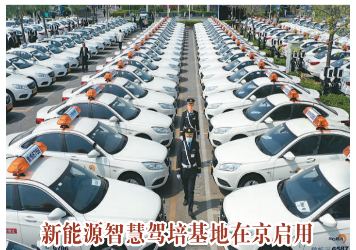
新能源智慧驾培基地在京启用

大会共设4个分站赛、13条路线,既包含绿水青山托起的“门头沟小院+”路线,也涵盖了红色抗战的人文风景,通过分站赛、月月走、线上走三种模式,为徒步爱好者呈现精彩纷呈的徒步活动。