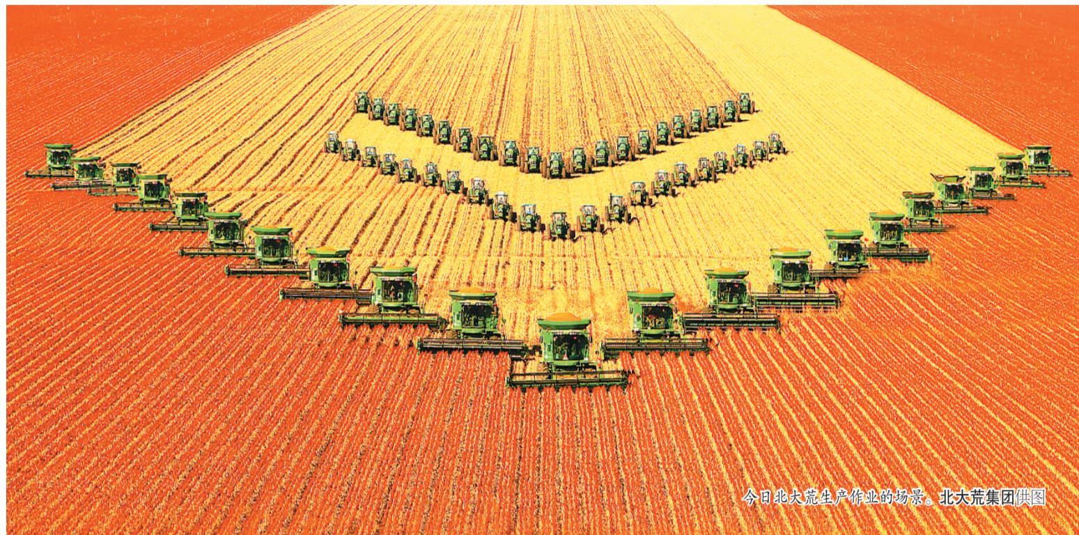
今日北大荒生产作业的场景。

承担东西部协作帮扶任务的有关省市区、中央单位定点帮扶牵头部门负责人、中央农办、农业农村部、国家乡村振兴局主要负责同志等参加会议。