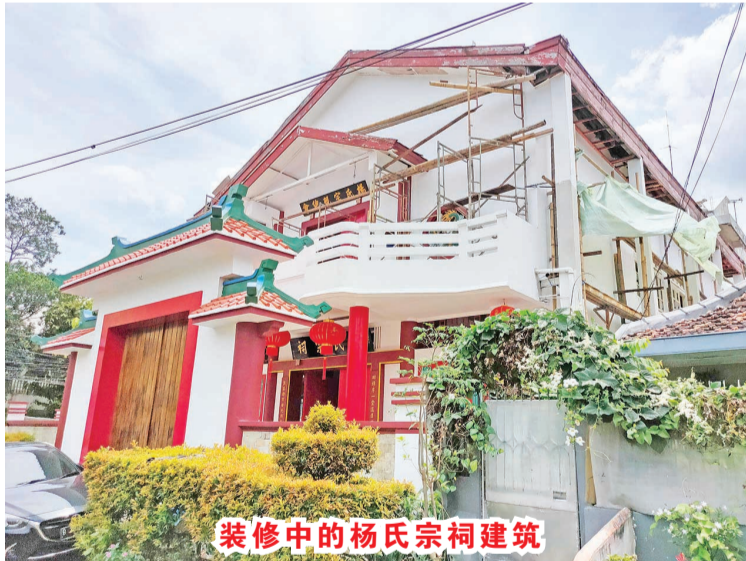
装修中的杨氏宗祠建筑