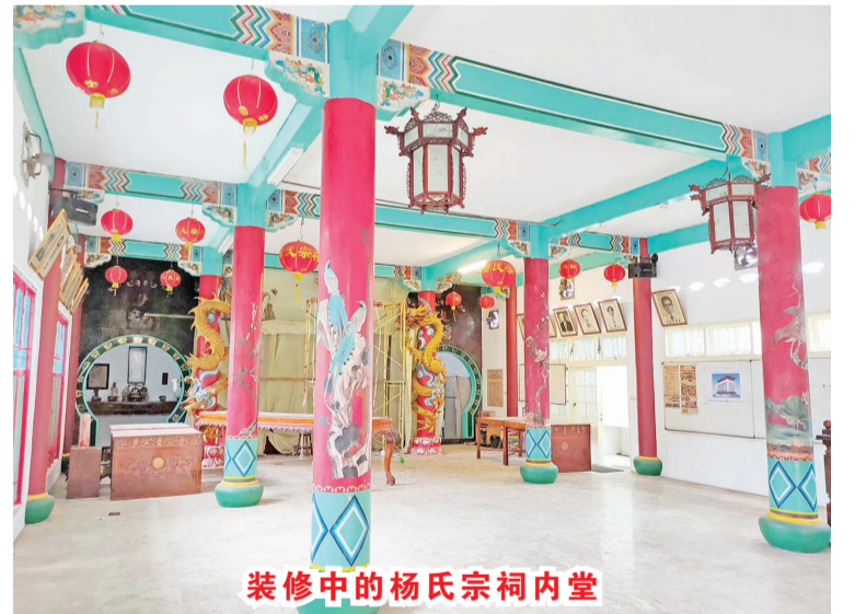
装修中的杨氏宗祠内堂