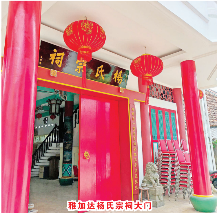
雅加达杨氏宗祠大门