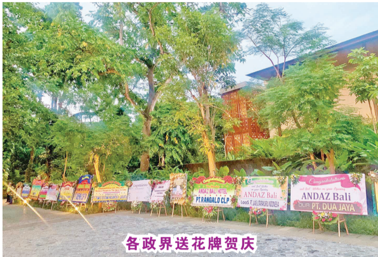
各政界送花牌贺庆