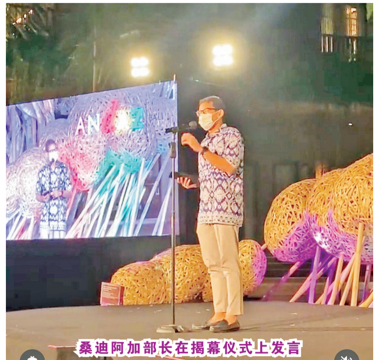
桑迪阿加部长在揭幕仪式上发言