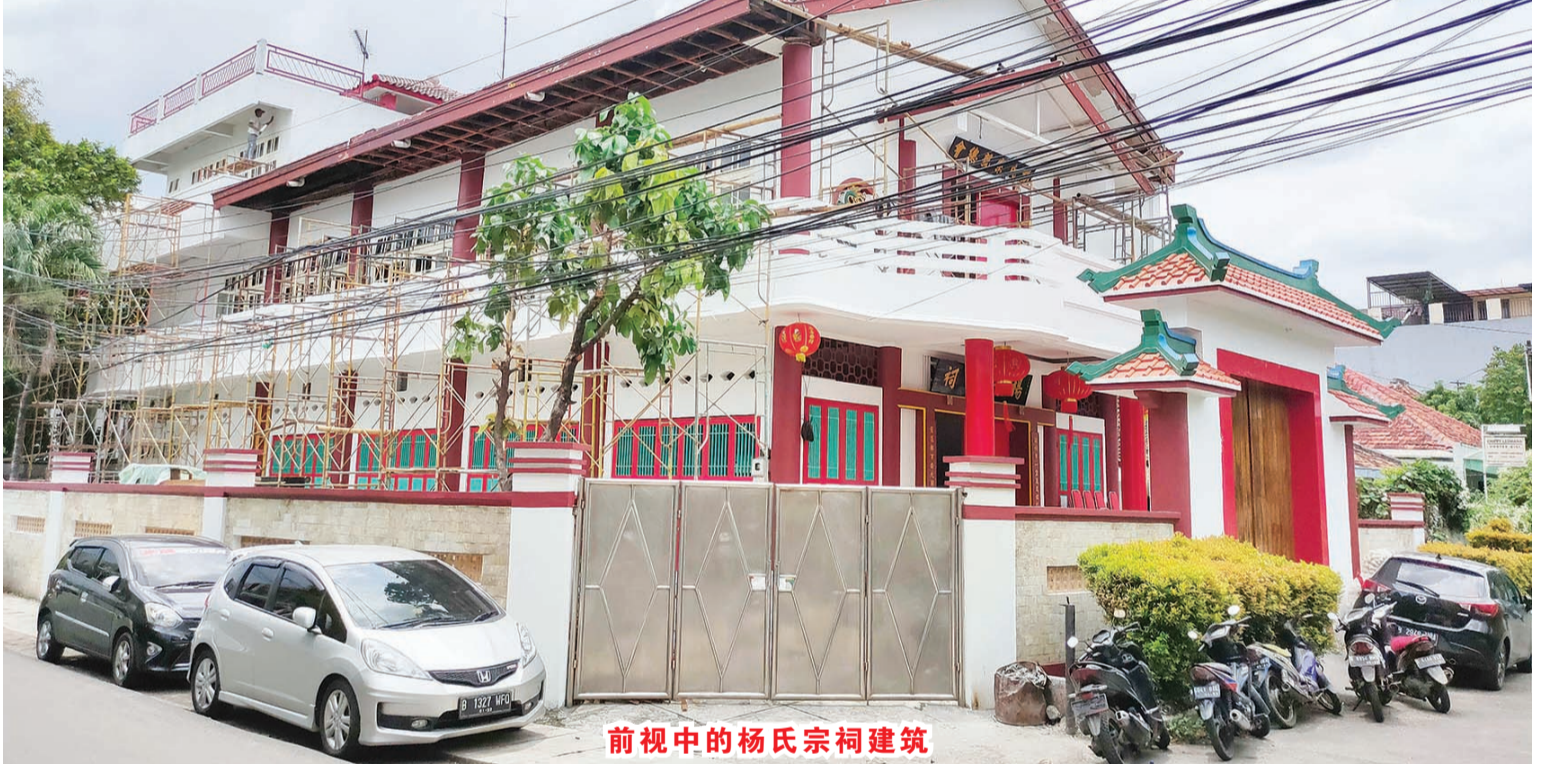
前视中的杨氏宗祠建筑

杨氏基金会主席及理事期待宗亲们的祈祷与支持，这样装修就可以顺利完成。雅加达杨氏宗祠的建筑状态能够保持庄严与美观，并且可以像以前一样再次使用。