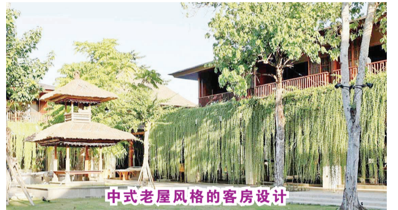
中式老屋风格的客房设计