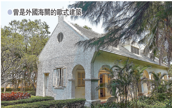
● 曾是外國海關的歐式建築