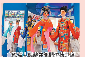
● 臨高人偶戲在鄉間流傳甚廣

如果是逢年過節到臨高，就有機會欣賞到已傳承800餘年的人偶戲，這個源於南宋末期的地方戲曲已被列入國家級非物質文化遺產名錄。臨高人偶戲是從民間用佛像祭祀的宗教活動演變而來，其表演特點為幕台不設布幔，演員手擊木偶化裝登台，人與偶在台上共同扮演角色，人偶互為一體，以瓊劇唱腔表演為基