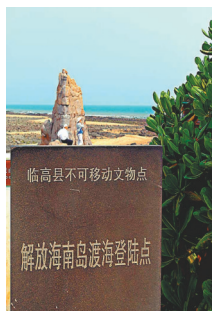
● 臨高縣不可移動文物點