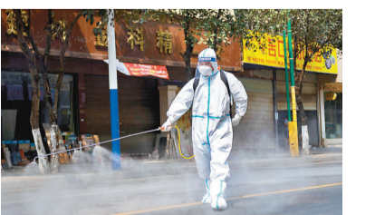
●4月7日，工作人員在對瑞麗市一街道進行消毒。

另據中國國家衛生委網站消息，7日報告新增新冠肺炎確診病例24例，其中境外輸入病例13例，本土病例11例，均在雲南瑞麗市。自3月31日瑞麗市報告發現新冠肺炎確診病例和無症狀感染者後，連續9天出現新增確診病例，主城区繼續實施居家隔離管理。截至6日，雲南省已累計接種新冠疫苗375.08萬劑次，累計完成接種334.78萬人。