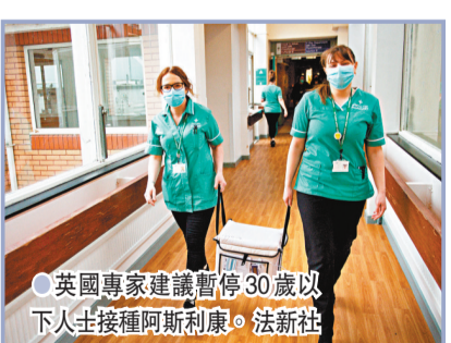
●英國專家建議暫停30歲以下人士接種阿斯利康。法新社

香港文匯報訊 綜合報道：圍繞牛津/阿斯利康疫苗安全性的風波持續發酵，歐洲藥品管理局(EMA)7日發表聲明，指出阿斯利康疫苗引發血栓副作用的情況「極罕見」，並不存在特定風險，儘管兩者之間「可能存在關聯」，但疫苗好處仍大於風險，因此不會對