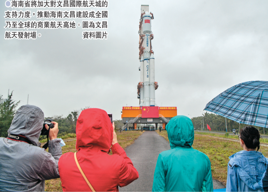
●海南省將加大對文昌國際航天城的支持力度，推動海南文昌建設成全國乃至全球商業航天高地。圖為文昌航天發射場。

在其他重點市場領域，中國準備優化海南商業航天領域市場准入環境，支持商業衛星與載荷領域產學研用國際合作，鼓勵開展衛星數據的國際協同開發應用與數據共享服務，並制定吸引國際商業航天領域高端人才與創新團隊落戶的特別優惠政策。支持海南統一布局新能源汽車充電基礎設施建設和運營，放寬5G融合性產品和服務的市場准入限制，推進車路協同和無人駕駛技術應用。