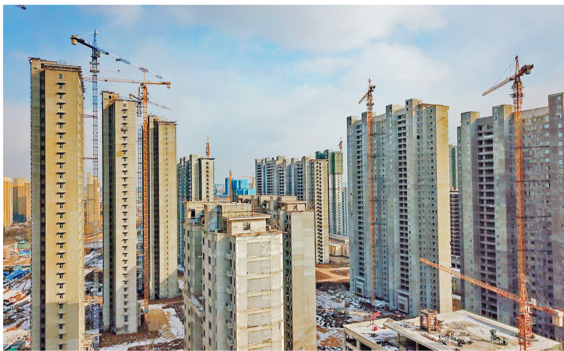
圖為長春市生態大街附近的一處在建樓盤。

【香港商報訊】記者王長久報道：在昨日國新辦新聞發布會上，財政部財稅司司長王建凡表示，將健全以所得稅和財產稅為主體的直接稅體系，逐步提高直接稅佔稅收收入比重。進一步完善綜合與分類相結合的個人所得稅制度，積極穩妥推進房地產稅立法和改革。分析人士認為，今年房地產稅立法將加快進程，房地產稅在長效機制和房地產發展中的重要作用無可替代，在整個「十四五」時期，內地都會加快房地產稅立法，開徵亦勢在必行。