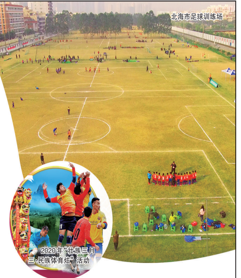
北海市足球训练场 2020年“壮族三月三·民族体育炫”活动

重大体育产业项目纷纷落地。占地约1万亩的中国—东盟健康运动产业园已在防城港揭牌；总投资50亿元的中国—东盟拳击学院已初步落实选址意向；总投资135亿元的广西射击射箭中心正在选址；南宁三塘智力运动综合体、上林国际马术运动康养基地、武宣七星湖体育综