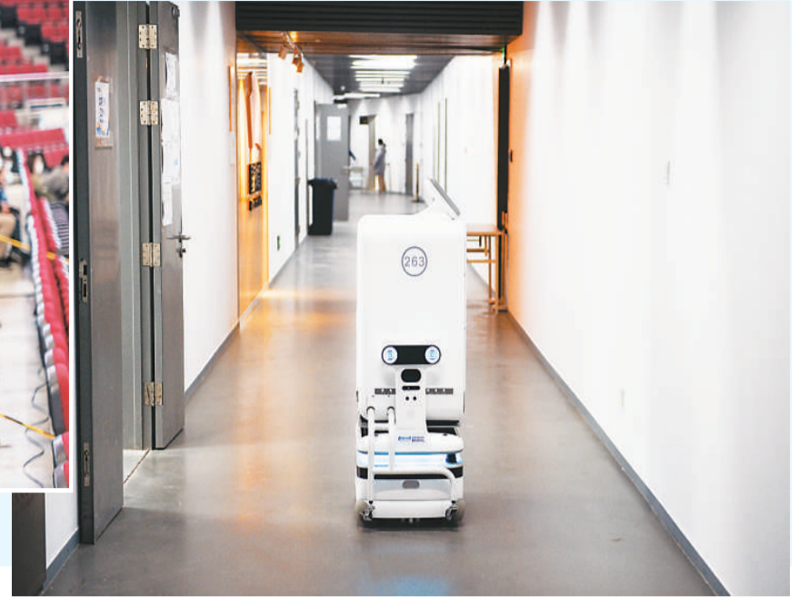
运送成绩单的智能机器人在国家体育馆工作。