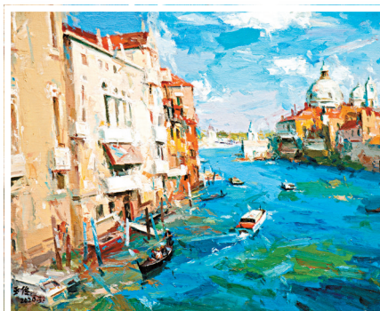
● 巫俊作品《威尼斯大運河》