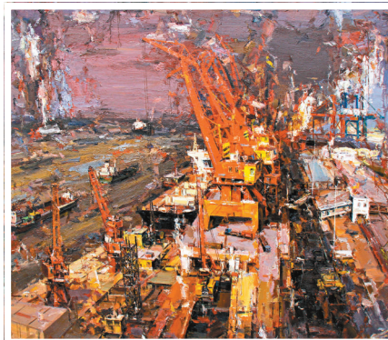
● 巫俊作品《繁忙的大江碼頭》