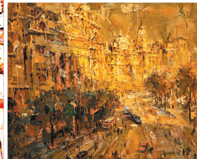
● 巫俊作品《上海外灘印象》