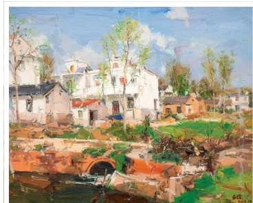
● 巫俊作品《四月鄉村》