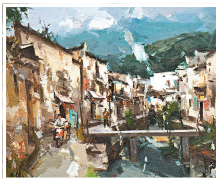
● 巫俊作品《徽州古鎮之二》