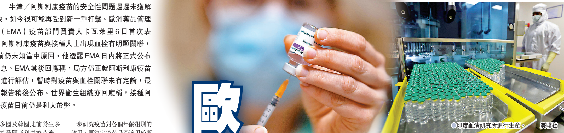
● 印度血清研究所進行生產。