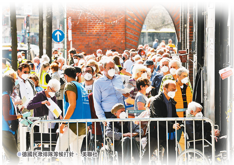
● 德國民眾排隊等候打針。