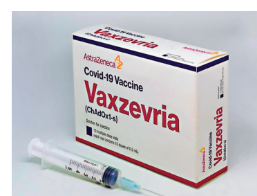
● 阿斯利康將疫苗改名為Vaxzevria。

阿斯利康疫苗在歐洲事故頻生，首先是疫苗保護力數據受質疑，接着發生向歐盟供應量減，再在歐洲各地傳出接種後引發血栓案例。血栓事件一度引發歐盟逾10國成員國宣布暫停接種，雖然在EMA上月中強調阿斯利康疫苗安全有效後，多國恢復接種，但EMA也表示，