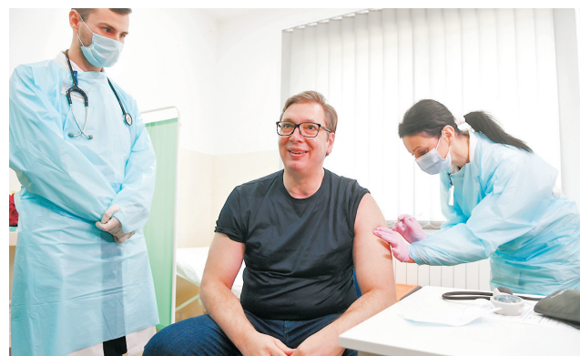
● 塞爾維亞總統武契奇接種國藥疫苗。

有700萬人口的塞爾維亞至今已為260萬公民接種疫苗，其中超過100萬人已經接種了第二劑，以接種率計在全歐洲僅次於英國，武契奇多次將這歸功於中國及俄羅斯向塞國提供疫苗援助。 ●綜合報道