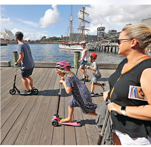
● 澳洲即將與新西蘭啟動「旅遊氣泡」，圖為悉尼民眾在踩滑板車。

澳洲政府6日表示，當局原定3月底前，為至少400萬人接種首劑新冠疫苗，但由於歐盟實施疫苗出口管制，澳洲仍未收到訂購的逾300萬劑牛津／阿斯利康疫苗，拖慢接種進度，以致目前僅接種了67萬劑。此外，維多利亞省一名44歲男子上周出現血栓，可能與疫苗有關，專家擔心會影響民眾對疫苗的信心。 ●綜合報道