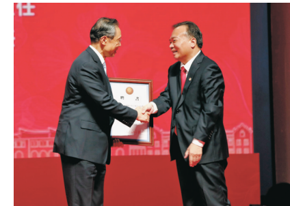
張彥（右）為鍾南山院士頒發傑出訪問教授聘書。

「欣逢盛世，當不負盛世。同學們現在是很好的時候，有很好的學習機會。」鍾南山勉勵廈門大學子，不單要有理想，還要有夢想；不單對自己有要求，還要有追求；不單要有志氣，還要有爭氣；不單有熱情，還要有激情。