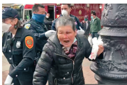
當地時間3月17日，華裔婆婆在舊金山市場街遭一名美國白人襲擊。

「希望美方真正踐行保護人權的承諾，嚴厲打擊針對包括亞裔美國人在內的少數族裔的歧視和仇恨暴力行為，切實保障少數族裔各項權利，讓少數族裔擺脫歧視仇恨犯罪的噩夢，不再生活在暴力和恐懼之中。」趙立堅說。