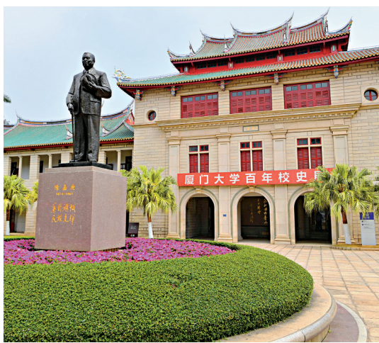
廈門大學由著名愛國華僑領袖陳嘉庚先生於1921年創辦。圖為位於廈門大學校園內的陳嘉庚雕像。

香港文匯報訊 據新華社報道，中共中央總書記、國家主席、中央軍委主席習近平6日致信賀廈門大學建校100周年，向全體師生員工和海外內外校友致以熱烈的祝賀和誠摯的問候。