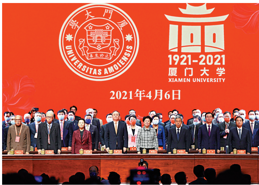
4月6日，慶祝廈門大學建校一百周年大會在廈門大學建南大會堂召開。圖為大會現場。

改革開放以來，中國大力推進高等教育走向世界，具有開放辦學傳統的廈大獲得新機遇。目前，廈大有1,900餘名外國留學生及港澳地區學生。截至2020年年底，廈大已與全球257所高校建立了夥伴關係，還發起全球八校聯盟等，參與10多個多邊合作平台。