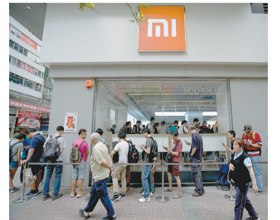
小米集團繼3月底正式就智能電動汽車業務立項後,旋即於4月初申請註冊「小米汽車」商標。資料圖片

中金早前報告指其拓展電動車業務,是該公司所提出「5G X AIoT」(人工智能與物聯網)戰略的關鍵部分,相信此亦代表了小米進入未來十年的新時代的開端。該行指,小米截至去年底手頭現金達1080億元人民幣,員工達3萬人,具強勁研發團隊,相信公司已有充足資源以進軍電動車業務。