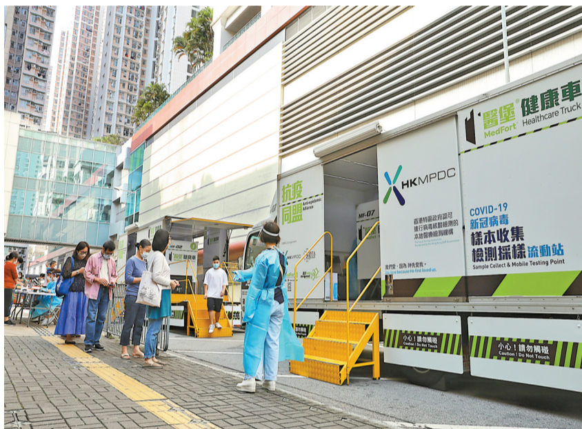
港昨增7宗確診，政府於油塘增設流動採樣站。

【香港商報訊】記者馮仁樂報導：本港新冠肺炎疫情放緩，衛生署衛生防護中心昨日公布，本港新增7宗確診個案，包括3宗本地關連個案，其中一名剛出生12日的大男嬰成為本港年齡最細的確診者；累計11531宗確診個案。雖然本地疫情持續放緩，但多名專家均憂慮在復活節假期後，疫情或會反彈，認為現階段不應放寬防疫措施。針對近日錄得多宗攜帶變種病毒株的輸入個案，專家均認為反映了海外人士抵港須到指定酒店檢疫21天的措施有成效，促請特區政府嚴格把關。