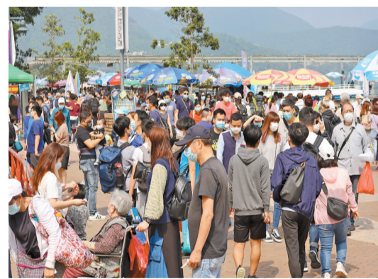
長假期最後一日，不少市民到西貢遊玩，西貢碼頭附近人山人海。

市民張女士表示，今年產品種類減少，很快就逛完，消費了近千元購買了健康飲品和食品，認為場內禁止飲食，氣氛差了很多。市民彭先生亦表示，沒有試食，消費亦減少了，希望疫情早日完結，可以重辦昔日的美食節。