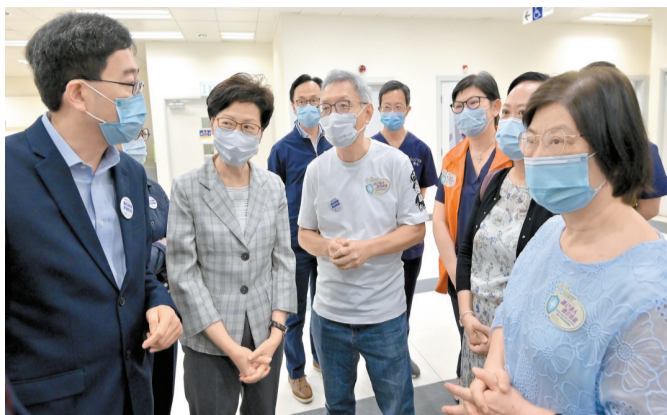
林鄭月娥（左二）昨視察伊館接種中心，期間聽取營運該社區疫苗接種中心的醫療機構人員介紹中心運作情況。

【香港商報訊】記者周偉立報導：因應特區政府4月5日起恢復為市民接種新一批抵港的復星疫苗，行政長官林鄭月娥昨日到訪灣仔伊沙伯體育館社區疫苗接種中心視察相關情況，同時為工作人員打氣及與到場接種疫苗的市民交談聽取意見。