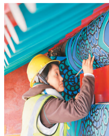
近日,世界文化遗产清西陵建筑维修保护工程进展顺利,目前已完成泰东陵、慕陵、崇陵等9座陵寝本体维修及慕东陵、昌妃园寝、泰妃园寝3座陵寝的彩画修缮工程。图为文保工人们对清西陵慕陵陵寝建筑进行彩画修复。