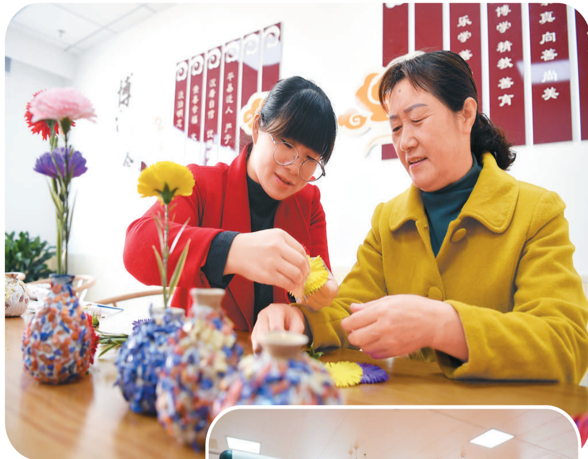
▲日前,安徽省合肥市肥西县上派镇“爱回家”居家养老服务中心正式开放,为周边老人提供休闲娱乐、基本医疗、餐饮等服务。图为老人(右)在该中心学习制作手工艺品。

在董登新看来,基本养老保险扩围的主要对象有城镇下岗职工及失业人员、在城乡之间流动的农民工和没有能力缴纳社保的农民等。一方面,他们的支付能力更弱,另一方面也可能缺乏对基本养老保险福利性质的认识。扩大覆盖面是