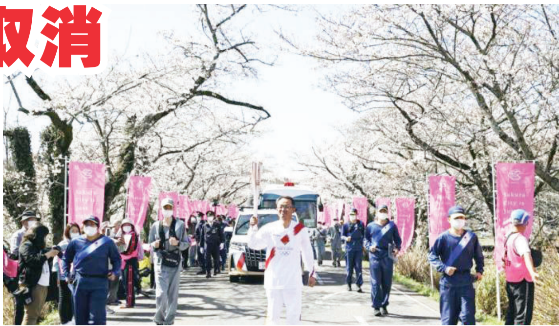
资料图:当地时间3月29日,日本栃木,2020东京奥运会火炬传递第5日,火炬在一片樱花树下传递,道路两旁樱花盛开美如画。

3月25日上午,东京奥运圣火传递在日本福岛县启动,然后按照顺时针巡回日本。经过约1万名火炬手传递后,圣火将在7月23日的开幕式上,在国立竞技场的圣火台上点燃。