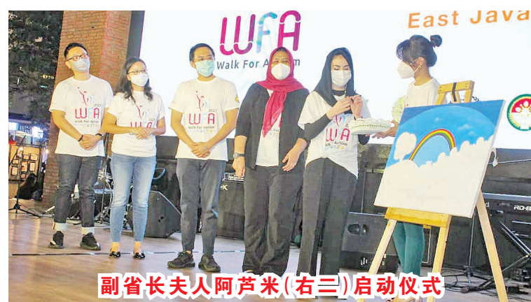
副省长夫人阿芦米 (右三) 启动仪式