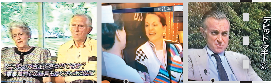
●探訪費奇女兒夫婦和孫女 ●委託聯繫人探訪大衛·馬吉，在耶魯神學院圖書館拍攝威爾遜醫生日記