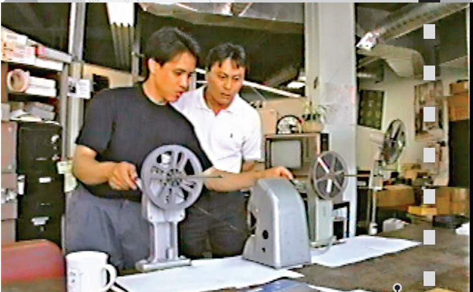
●隻身赴美通過費奇孫女在洛杉磯找到費奇11分鐘版馬吉影片