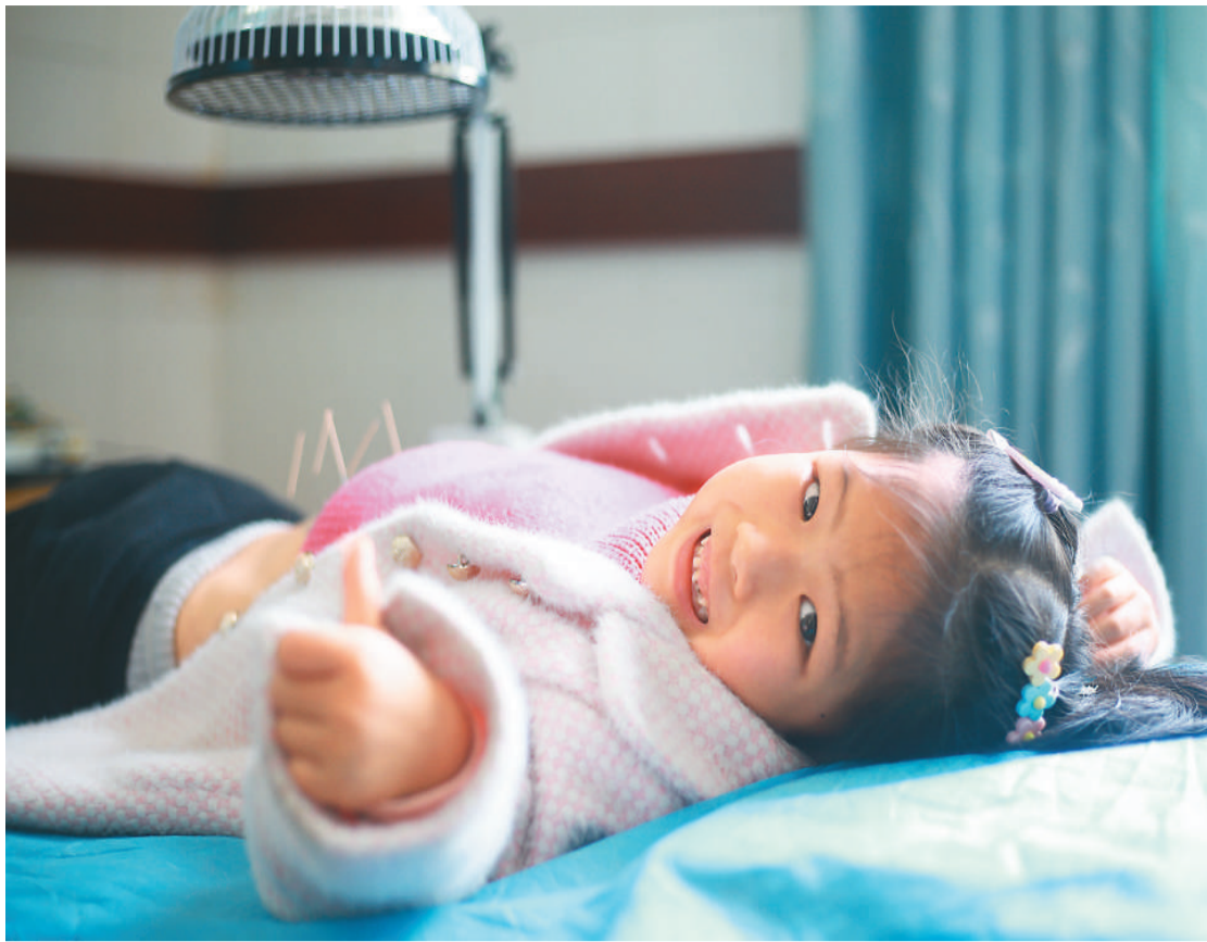
3月24日，在湖南省永州市蓝山县县域医共体楠市分院，医生在为患者进行针灸治疗。近年来，该县加快推进县域紧密型医共体建设，从总院选拔优秀中医专家下沉到分院，通过传、帮、带，帮助分院中医药人员熟练掌握针灸、拔罐、推拿、刮痧等传统中医适宜技术，有效促进基层卫生院中医适宜技术健康发展。

“同时要加大中医药科技创新平台建设。”李昱介绍，中国将在中医理论、中药资源、现代中药制剂、中医药疗效评价等重点领域建设一批国家重点实验室；围绕心血管疾病、神