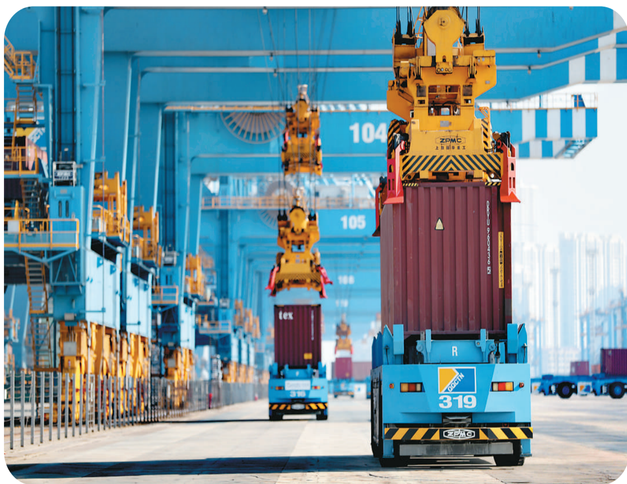
在忙而有序地来回穿梭。

此外,中国还设有沿边重点开发开放试验区、边境经济合作区、跨境经济合作区、内陆开放型经济试验区等各类开放平台,在不同时期、不同区域各自发挥着改革开放“试验田”的先行作用。