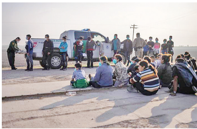
资料图:当地时间3月17日,美国得克萨斯州,边境执法人员与前来寻求庇护的非法移民家庭。

中新网4月6日电 据美国中文网报道,美国南部边境的移民危机仍在持续发酵。5日发布的民意调查显示,大多数美国人反对总统拜登处理边境无人陪伴移民儿童的方式;65%的人表示让移民家庭团聚是第一要务。