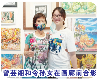
曾芸湘和令孙女在画廊前合影