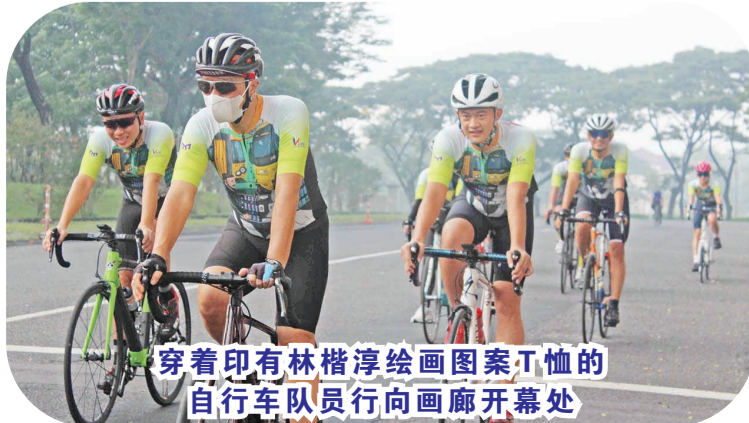
穿着印有林楷淳绘画图案T恤的自行车队员行向画廊开幕处