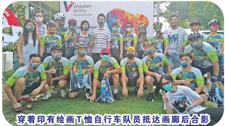
穿着印有林楷淳绘画图案T恤的自行车队员抵达画廊后合影