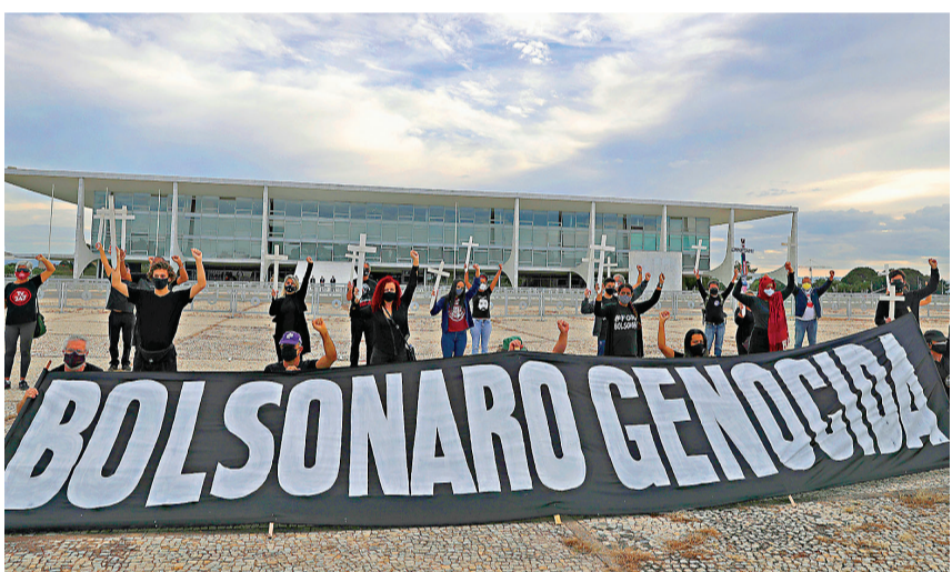
●示威者展示寫有「博爾索納羅大屠殺」的標語，指控他抗疫不力，令疫歿人數居高不下。

巴拉班強調，若沒有長期的對抗飢餓政策，糧食不安全的風險將永遠存在。巴西利亞大學教授梅代羅斯亦表示，巴西從未徹底解決糧食安全問題，差不多1/3人口生活在糧食無保障之下，這比例在疫情中料會上升。他指出疫情是經濟危機的源頭，若未能控制醫療衛生危機，經濟也不會好轉，「唯有透過收入保障計劃，免費分發口罩和加速疫苗接種，才能扭轉貧困加深情況。」 ●綜合報道