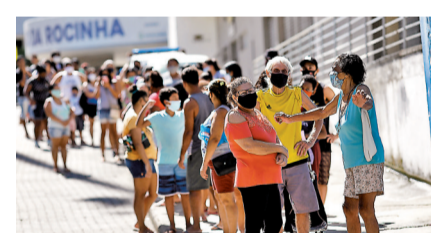
●居民排隊等候領取食物。

巴西新冠肺炎疫情嚴峻，加上通脹和失業率飆升，據專家指出，當地貧民正面對飢餓威脅，巴西恐重返「飢餓地圖」。「飢餓地圖」是聯合國世界糧食計劃署關於全球糧食短缺狀況的調查，當一個國家的營養不良影響到5%以上的人口時，就被列入其中，例如委內瑞拉、墨西哥、印度、阿富汗和幾乎所有非洲國家，都出現在2019年的地圖上。巴西於2014年脫離「飢餓地圖」，但巴西地理統計局數據顯示，經過多年的政治動盪和經濟增長低迷，飢餓問題於2018年再次蔓延。隨著新冠疫情惡化，影響經濟和醫療衛生，要逃離飢餓更加困難。