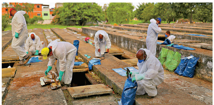
●挖墳工人加快檢骨運葬。

巴西是全球疫歿人數第二高的國家，僅次於美國，自2月以來更持續攀升。巴西布坦坦研究所上週表示，在境內發現一種新型變種毒株，與最早在南非出現的變種病毒相似。鄰國玻利維亞隨即宣布，因應巴西發現新變種病毒，將關閉與巴西接壤的邊界。 ●綜合報道