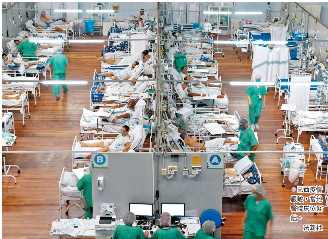
●巴西疫情嚴峻，當地醫院床位緊絀。